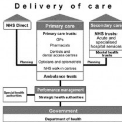
Figura 1. NHS, prima